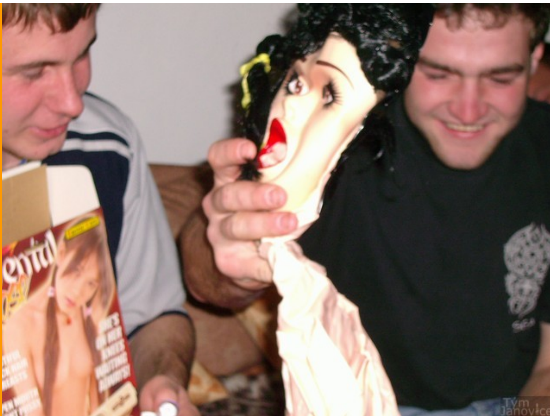
Účinkují: uživatelé stránek Janovice tým