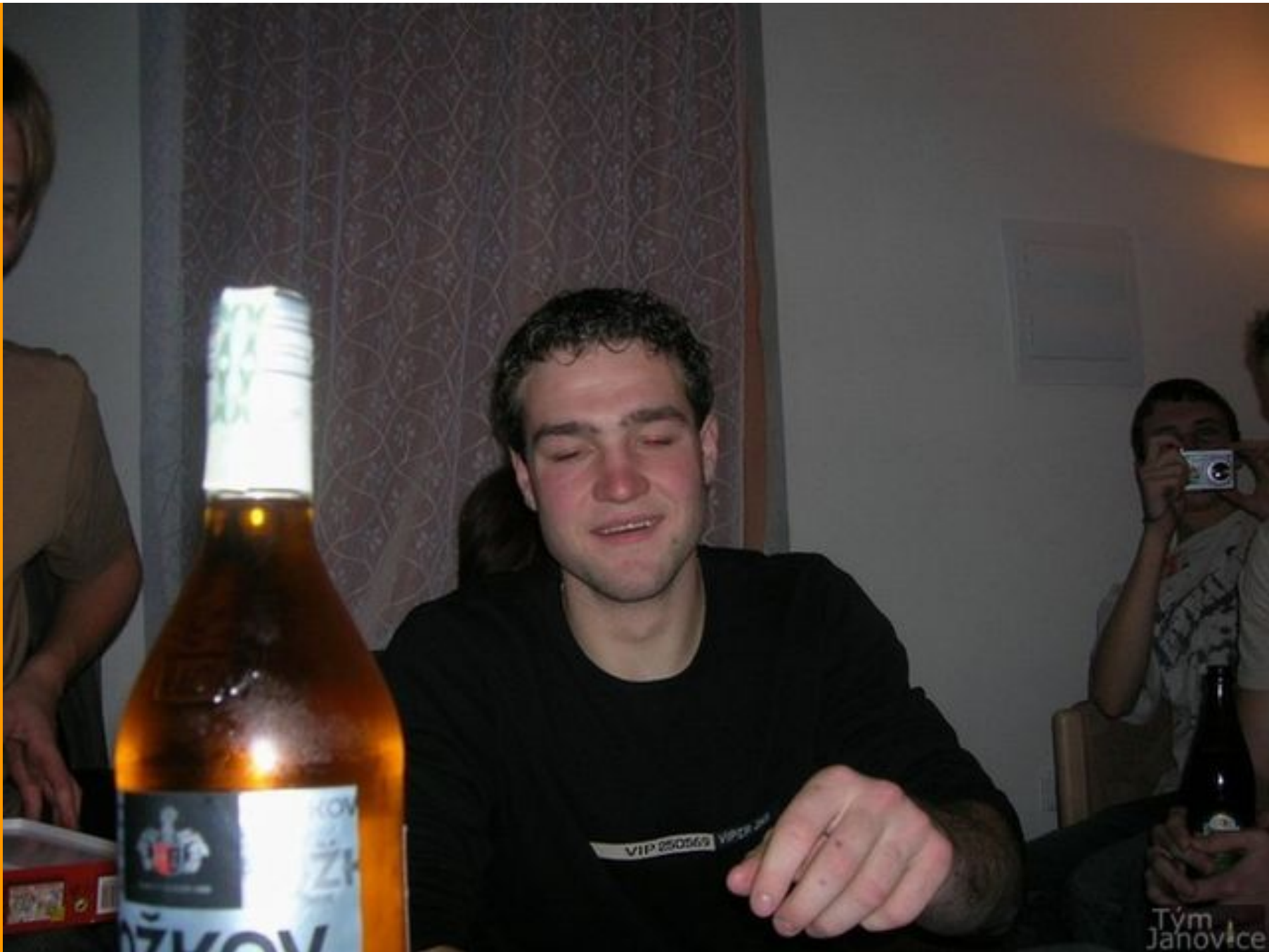
Účinkují: uživatelé stránek Janovice tým