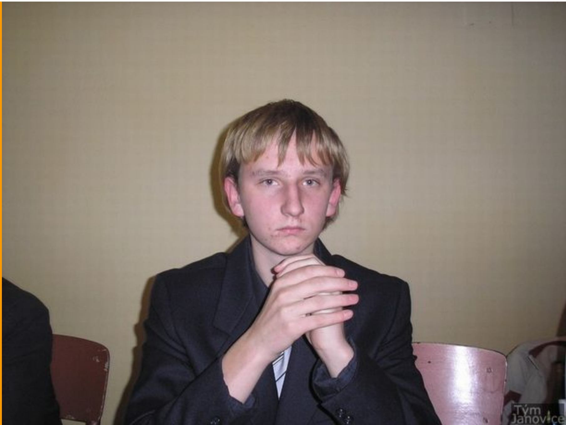
Účinkují: uživatelé stránek Janovice tým

Já to říkám furt, že se se mnou vždycky každý dohodne!