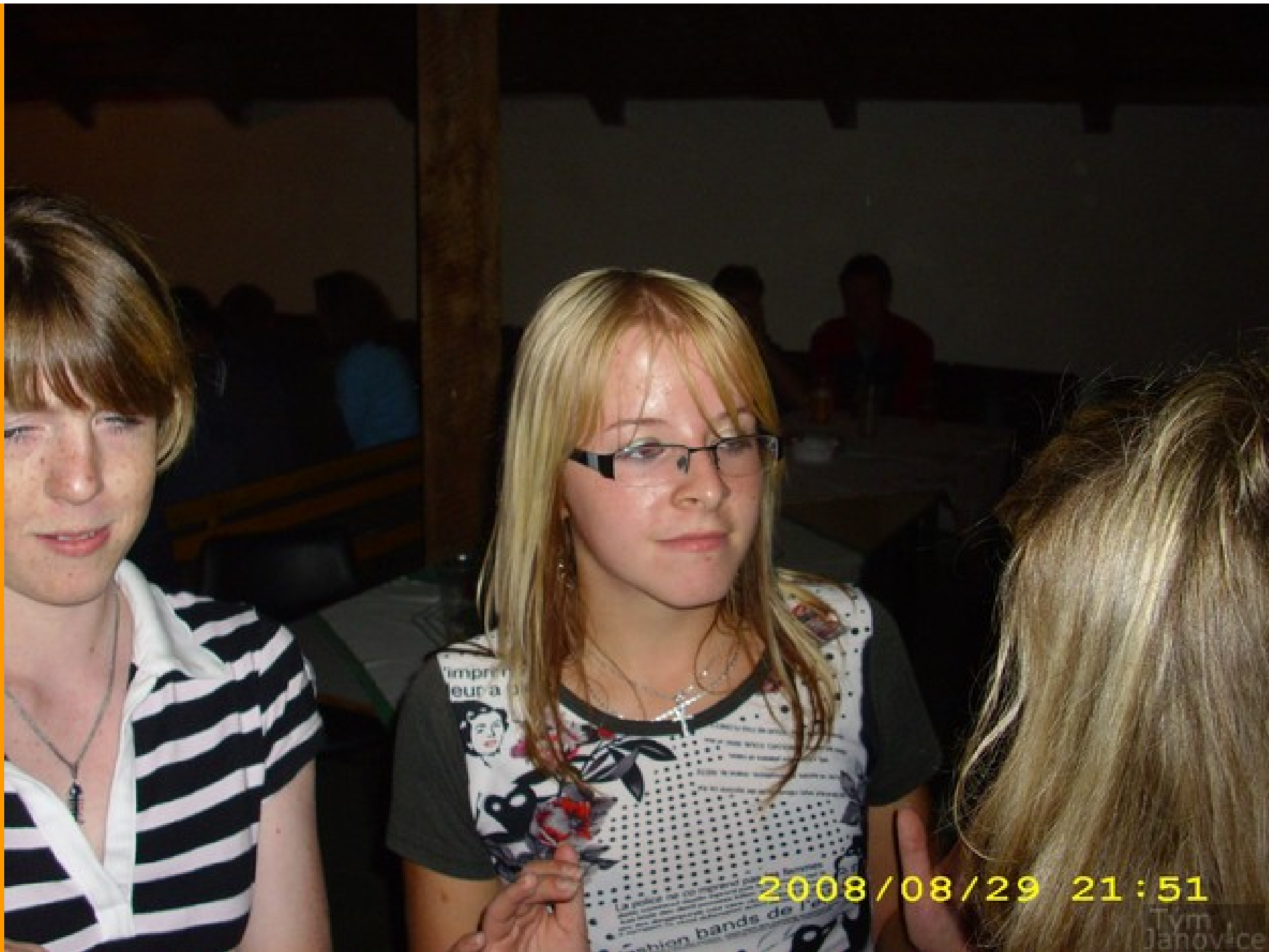
Účinkují: uživatelé stránek Janovice tým