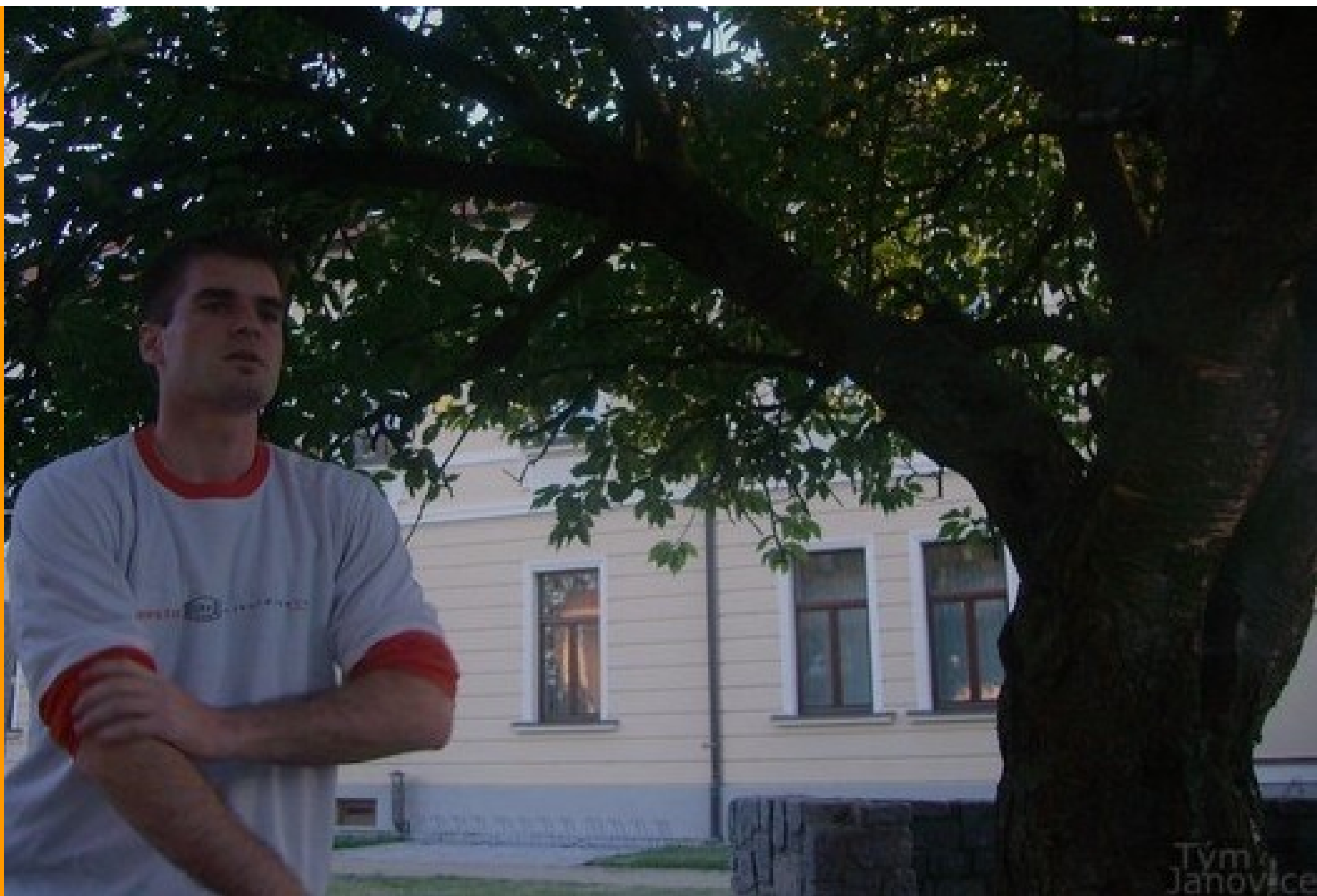
Účinkují: uživatelé stránek Janovice tým