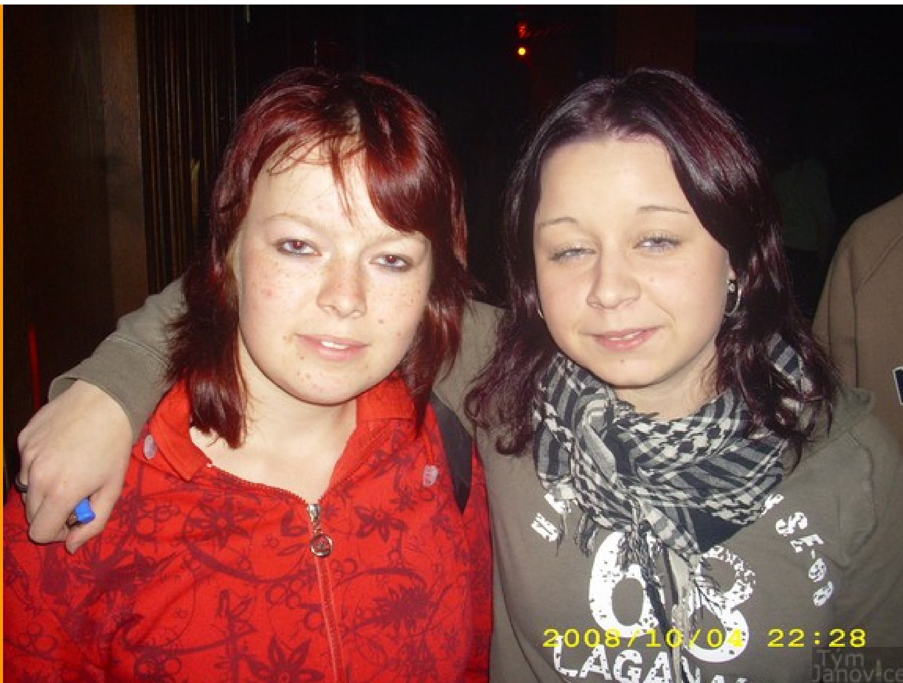
Účinkují: uživatelé stránek Janovice tým