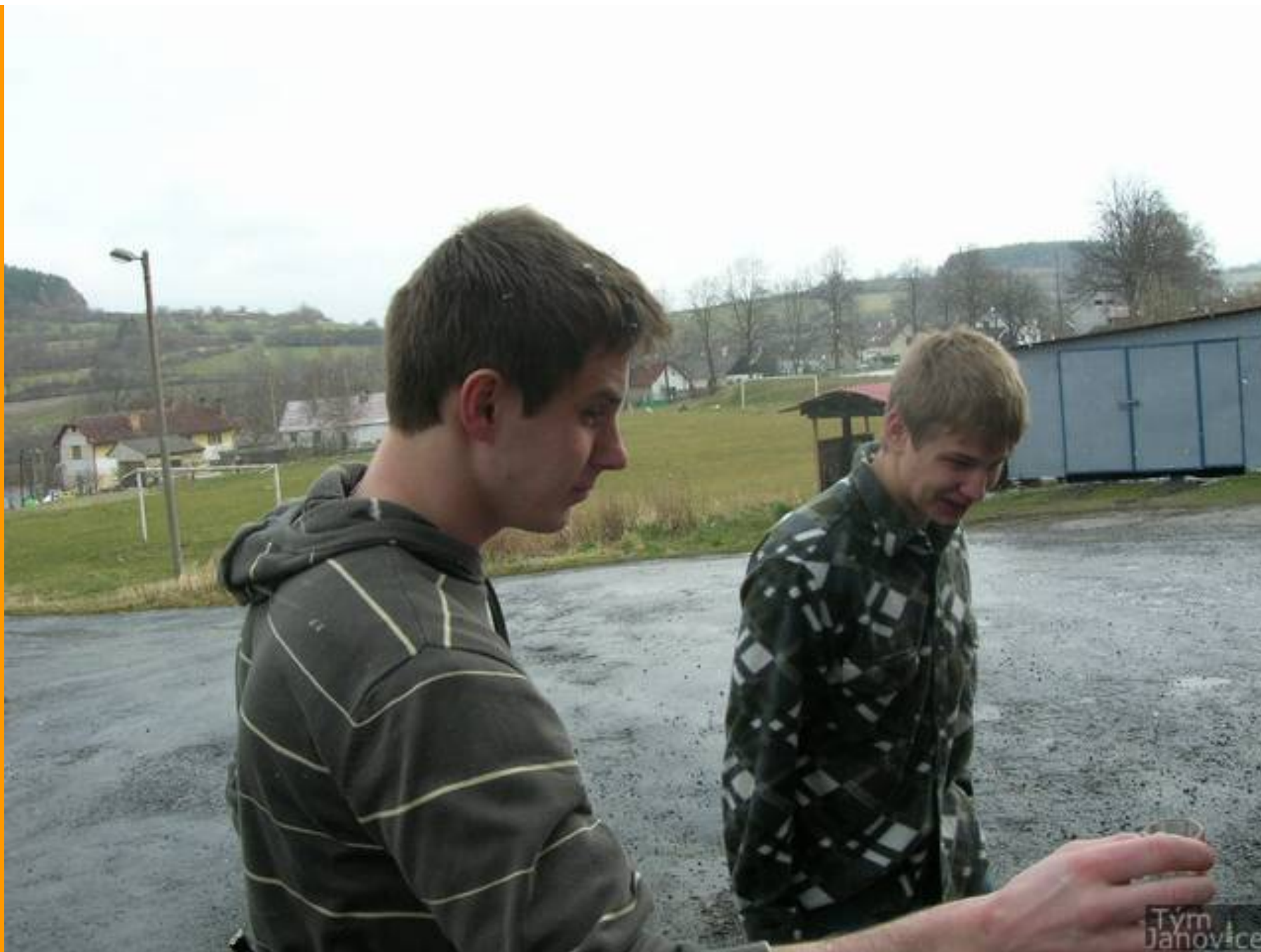
Účinkují: uživatelé stránek Janovice tým