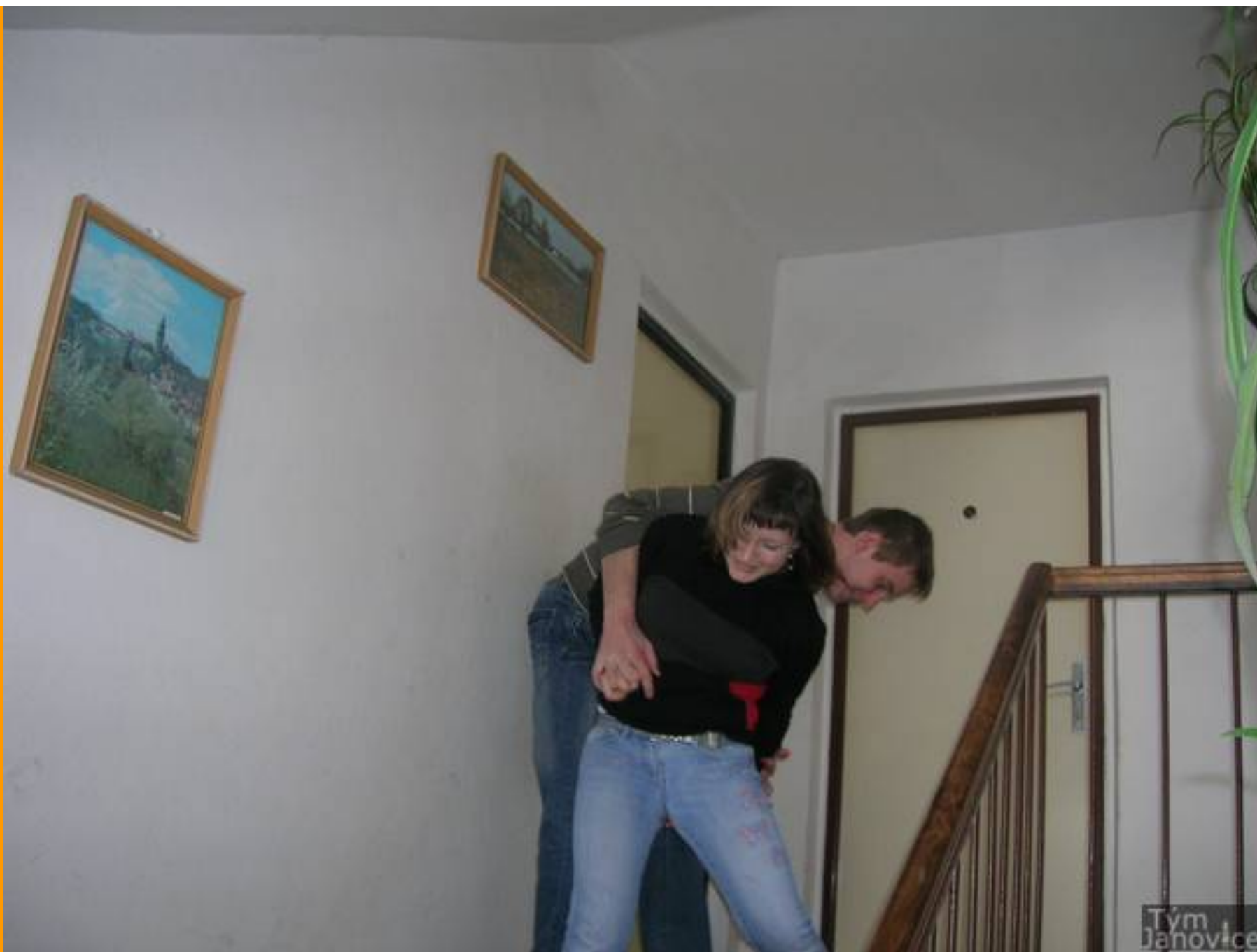
Účinkují: uživatelé stránek Janovice tým