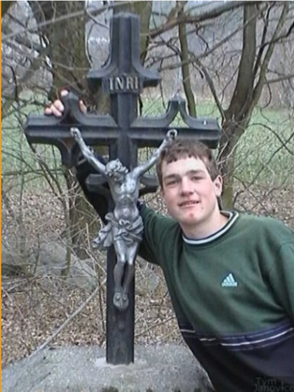
Účinkují: uživatelé stránek Janovice tým