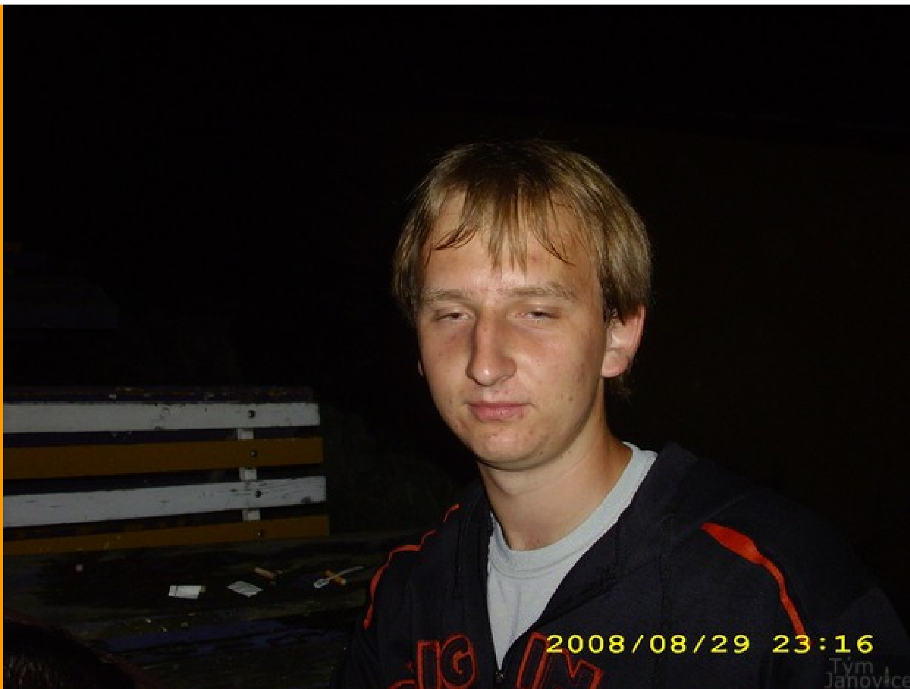
Účinkují: uživatelé stránek Janovice tým